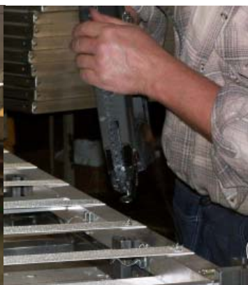
Fastskruvning i ramen