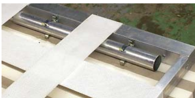
Ben i transportläge

Liggplan: detta är sängens viktigaste del. Många krav måste uppfyllas för att nå en både omedelbar och långsiktigt hög kvalitet. Låg vikt, elastisk för anpassning till kroppen men trots detta låg töjning för att undvika bestående formförändring. Materialet skall kunna monteras till ramen på ett säkert sätt. Alla delar måste monteras med samma inspänningskraft. Vårt val blev band av syntetmaterial. Dessa har den styrka och elasticitet som krävs. Vi valde 4 st längsgående och 9 st tvärgående band. För att spänna dessa på ett korrekt sätt har vi tillverkat en speciell utrustning för bandmonteringen. Banden skruvas fast i ramverket. För att hindra uppsplitsning vid avkapning sker detta moment med glödtråd och smältförsegling.